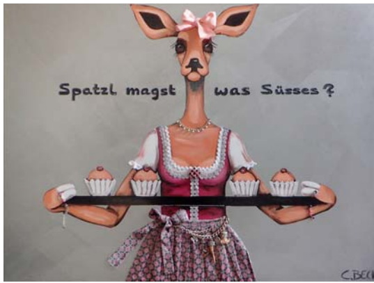
5C012 Spatzl magst was Süßes? 90/120 € 2900,-