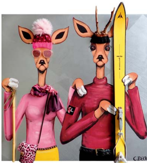
4P026 County colours 100/100 € 3300,-

All paintings are protected by trademark law! Alle Preise incl. 7% MwSt