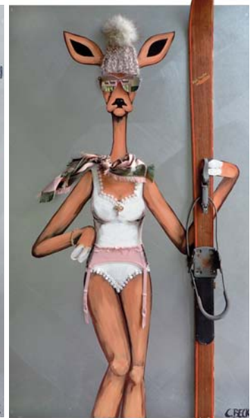
4K004 So hot! 80/140 € 2780,-