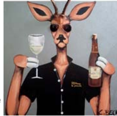
5B042 Rehturn to paradise® 60/60 € 1280,-

All paintings are protected by trademark law! Alle Preise incl. 7% MwSt