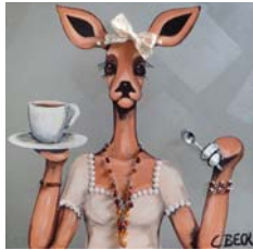
5C015 Coffeetime 60/60 € 1280,-