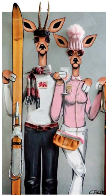
5A037 Alpenglamour 80/140 € 3500,-