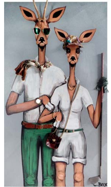
4K030 Goffleidenschaft 80/140 € 3500,-