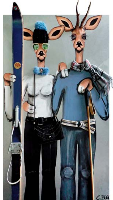
5A036 Snow motion 80/140 € 3500,-