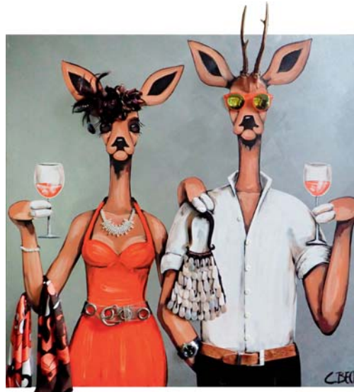
5B020 Sundowner 100/100 € 3300,-