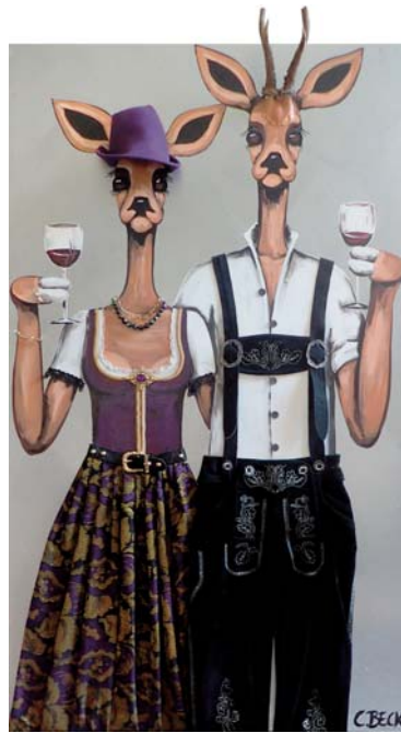
4Y006 Gipfelstürmer 80/140 € 3500,-