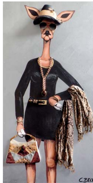
5A021 Ein bißer Reh-tro 70/140 € 2780,-