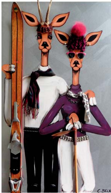
4L017 Skifoan 80/140 € 3500,-