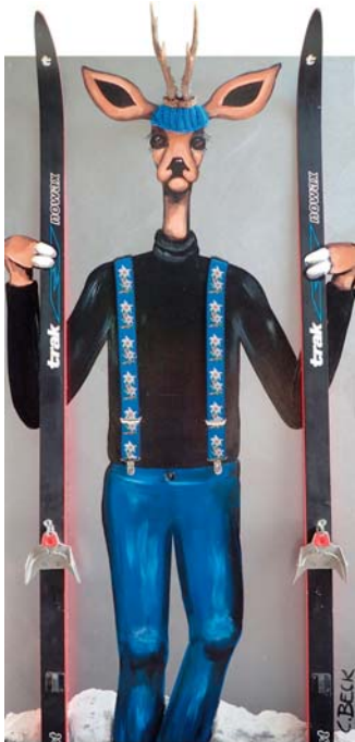
4W013 Meine Ski und I 70/140 € 2780,-