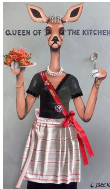
5C007 Queen of Kitchen 70/120 € 2780,-