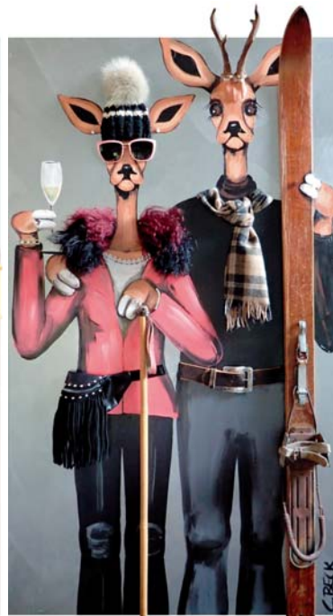
5B040 On the wild side 80/140 € 3500,-