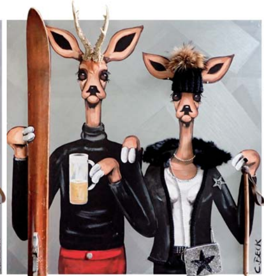
4W047 Wildlife 100/100 € 3100,-