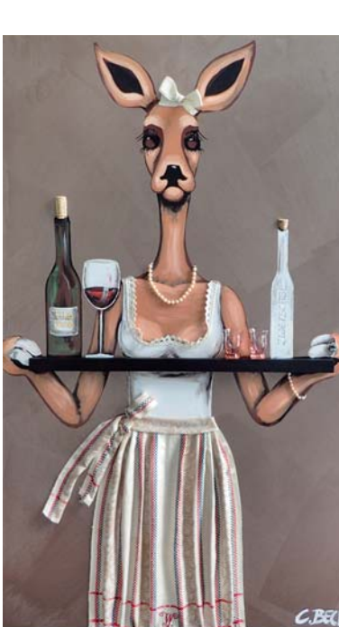
4U019 Mogst a Glaserl? 70/120 € 2780,-