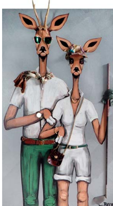
4K030 Golfleidenschaft 80/140 € 3300,-