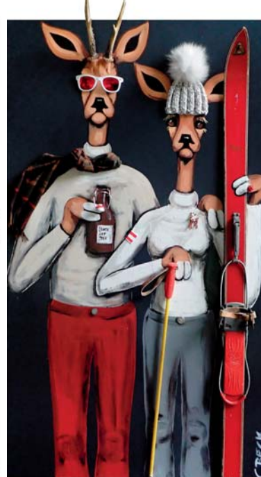
4S033 Nothing Compares 2 U 80/140 € 3300,-