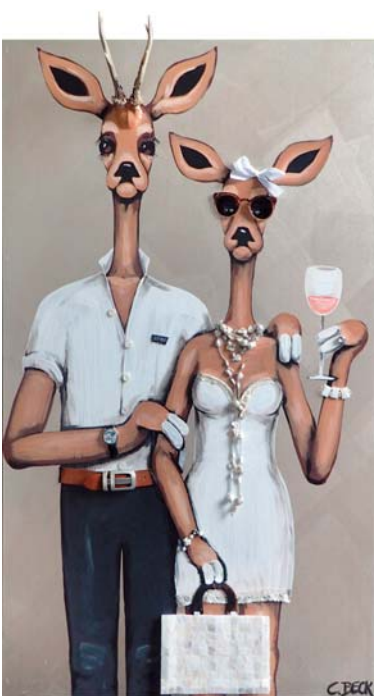
4U010 Sundowner 80/140 € 3300,-