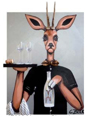
4Z038 Mogst a Glaserl 80/80 € 1380,-