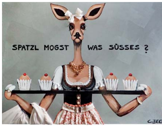
4Z045 Spatzl mogst was SüsSES? 90/120 € 2780,-