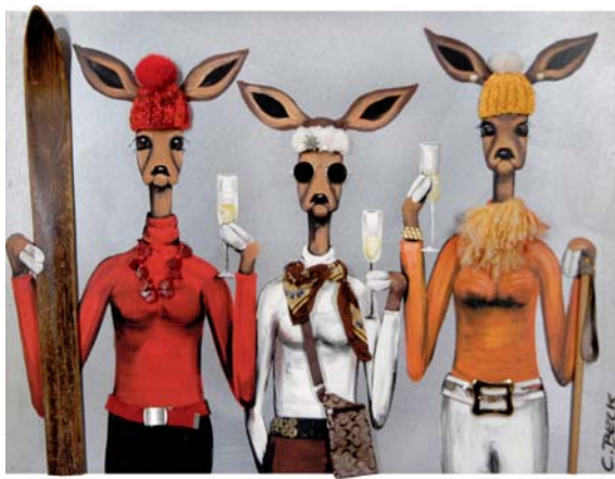
3G008 Proseccoschnecken® 90/120 € 3300,-