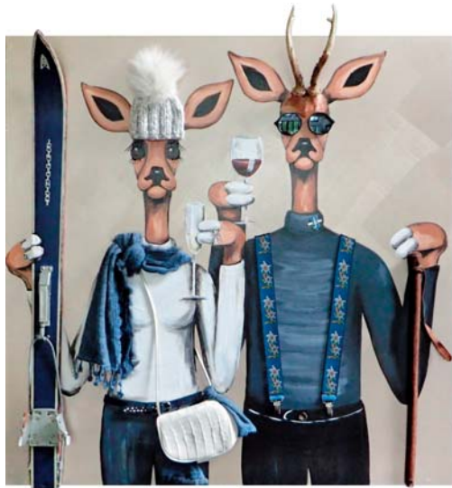
4Z048 Auf uns! 100/100 € 3100,-

All paintings are protected by trademark law! Alle Preise incl. 7% MwSt