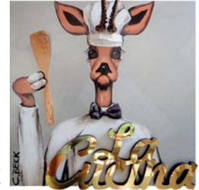
4R041 La Cucina 60/60 € 1180,-

All paintings are protected by trademark law! Alle Preise incl. 7% MwSt