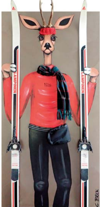
4V017 Langläufer 70/140 € 2780,-