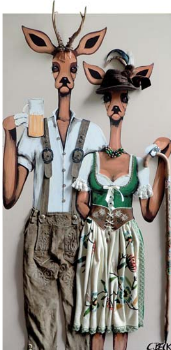
4S019 Trachtenliebe 80/160 € 3500,-