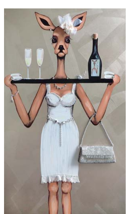
4S024 Seccoschneckerl® 80/140 € 2780,-