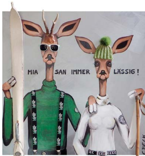
4E002 Gipfelstürmer 100/100 € 3100,-